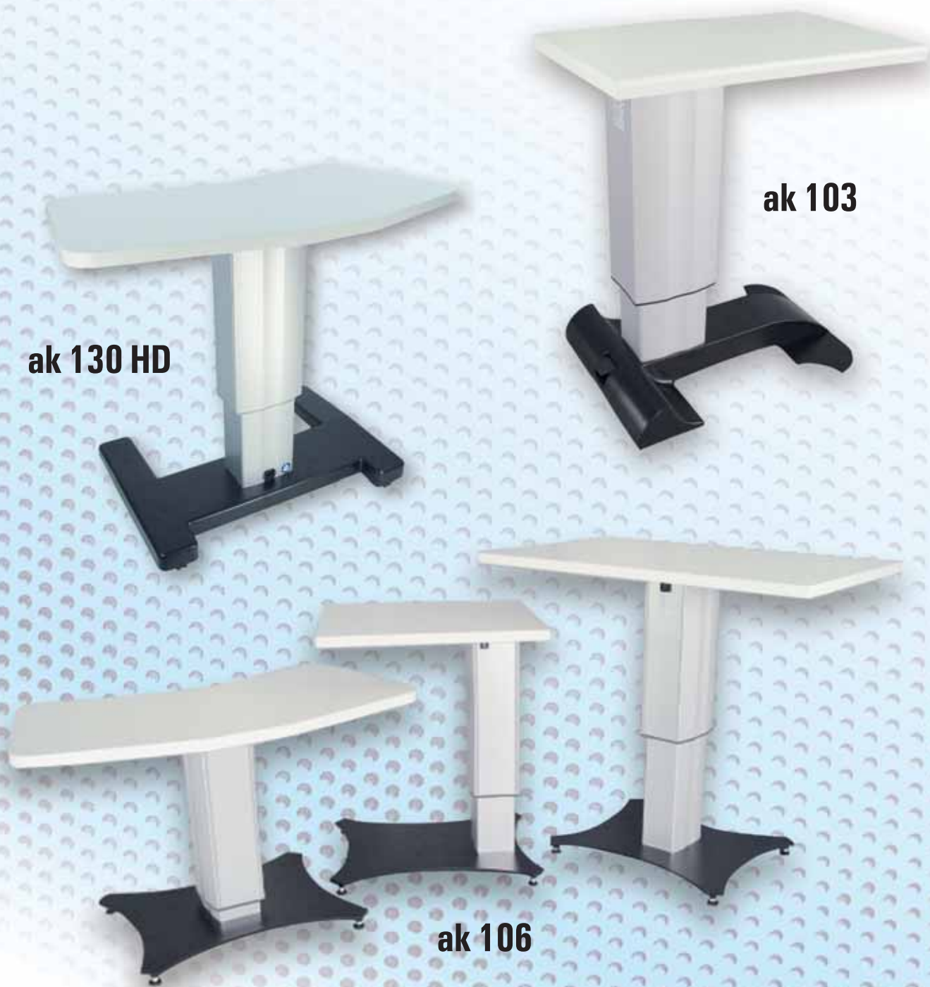
ak 130 HD